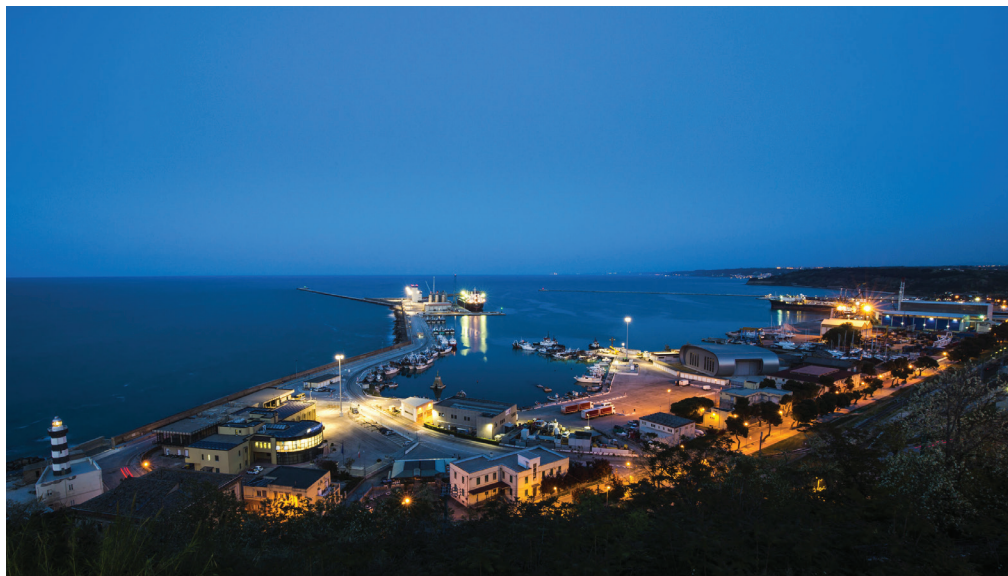
Porto di Ortona: ph. di Cristina Annibaldi

Il Credito è cumulabile con altri aiuti di Stato e con gli aiuti de minimis, nei limiti dell'intensità o dell'importo di aiuti più elevati consentiti dalla normativa europea. Al credito si aggiunge la riduzione del 50% dell'imposta sul reddito derivante dallo svolgimento dell'attività nella ZES, a decorrere dal periodo d'imposta nel corso del quale è stata intrapresa la nuova attività economica e per i sei periodi d'imposta successivi, secondo i criteri comunitari previsti "de minimis".