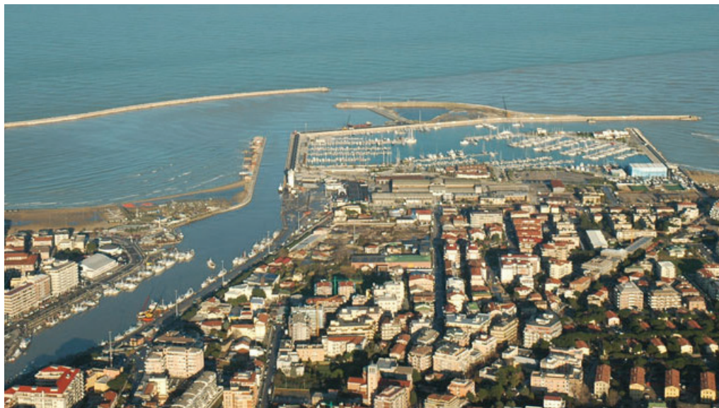
Porto di Pescara: ph. Autorità di Sistema Portuale del Mare Adriatico Centrale